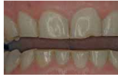
Stark abradierte Zähne als typische Folge des Zähneknirschens