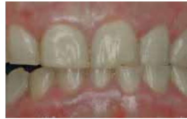
Patient knirscht unbewusst mit den Zähnen.

Übrigens erkennt man Stress oft auch an den Zähnen, zum Beispiel, wenn diese durch ständiges Knirschen (Bruxismus) abradiert sind.